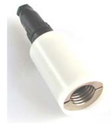
Beispielmessfassung für E27-Sockel

Dieses Messfassungssystem ist das ideale Hilfsmittel, um kostengünstig mit kundenspezifischen Messfassungen einfache Prüfungen zu realisieren.