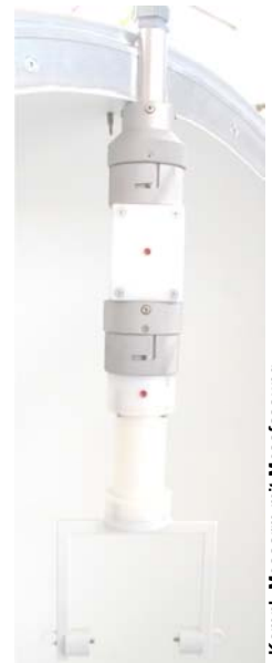
Kompl. Messarm mit Messfassung